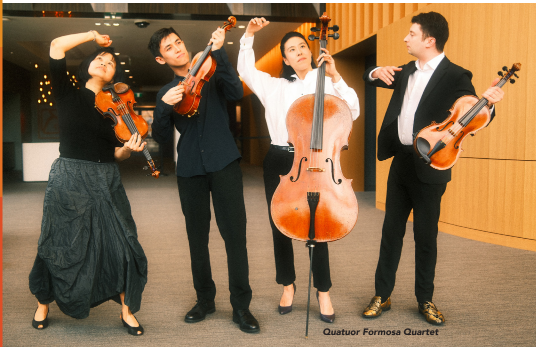
Quatuor Formosa Quartet

Owner, Guidonian Therapy Clinic | Propriétaire, Clinique de thérapie Guidonian Registered Massage Therapist | Massothérapeute agréée